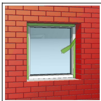
2. Bild: Zum gewünschten Zeitpunkt TP601 durch Abtrennen von Folie und Faden aktivieren.