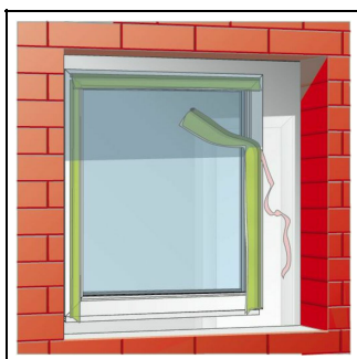
1. Bild: TP601 mit der Selbstklebung am Fensterrahmen fixieren.